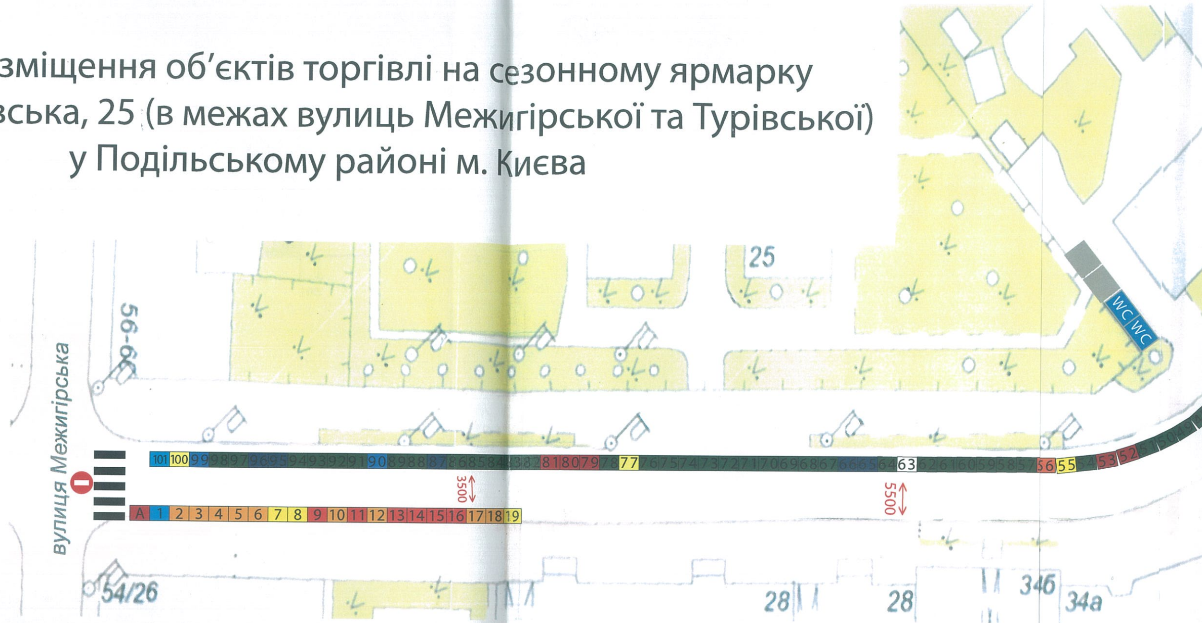
Схема розміщення об'єктів торгівлі на сезонному ярмарку по вул. Юрківська, 25 (в межах вулиць Межигірської та Турівської) у Подільському районі м. Києва