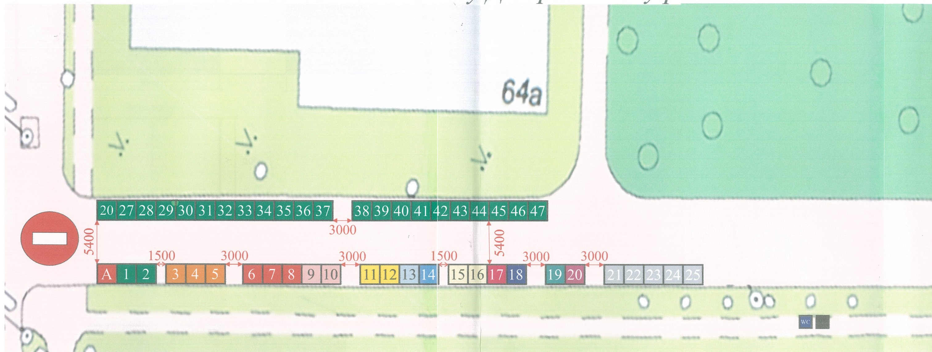
Схема розміщення об'єктів торгівлі на сезонному ярмарку по вул. 64а у Дніпровському районі м. Києва