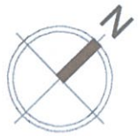
Схема розміщення об'єктів торгівлі під час проведення ярмарку по вул. Новопирогівська, 25 в Голосіївському районі м. Києва