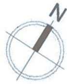
Схема розміщення об'єктів торгівлі під час проведення ярмарку по просп. Голосіївський, 116 в Голосіївському районі м. Києва