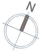
Схема розміщення об'єктів торгівлі під час проведення ярмарку по вул. Ковпака (в межах вулиць Великої Васильківської та Антоновича) в Голосіївському районі м. Києва