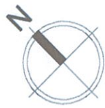
Схема розміщення об'єктів торгівлі під час проведення ярмарку по вул. Євгенія Харченка, 41-47 в Дарницькому районі м. Києва