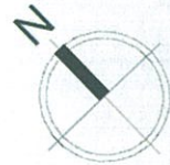
Схема розміщення об'єктів торгівлі під час проведення ярмарку по вул. Саксаганського, 69-75 в Голосіївському районі м. Києва